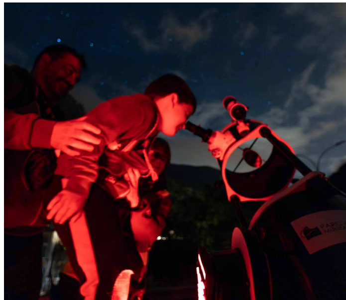
COMÚ DE LA MASSANA

On the one hand, the double star Albireo, one bluish and the other yellowish; and, on the other hand, Mizar, a star located within the constellation of the