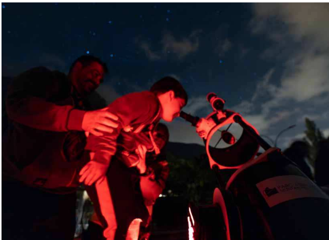
Instant del Festival d'Astronomia Andorra Comapedrosa 2024.