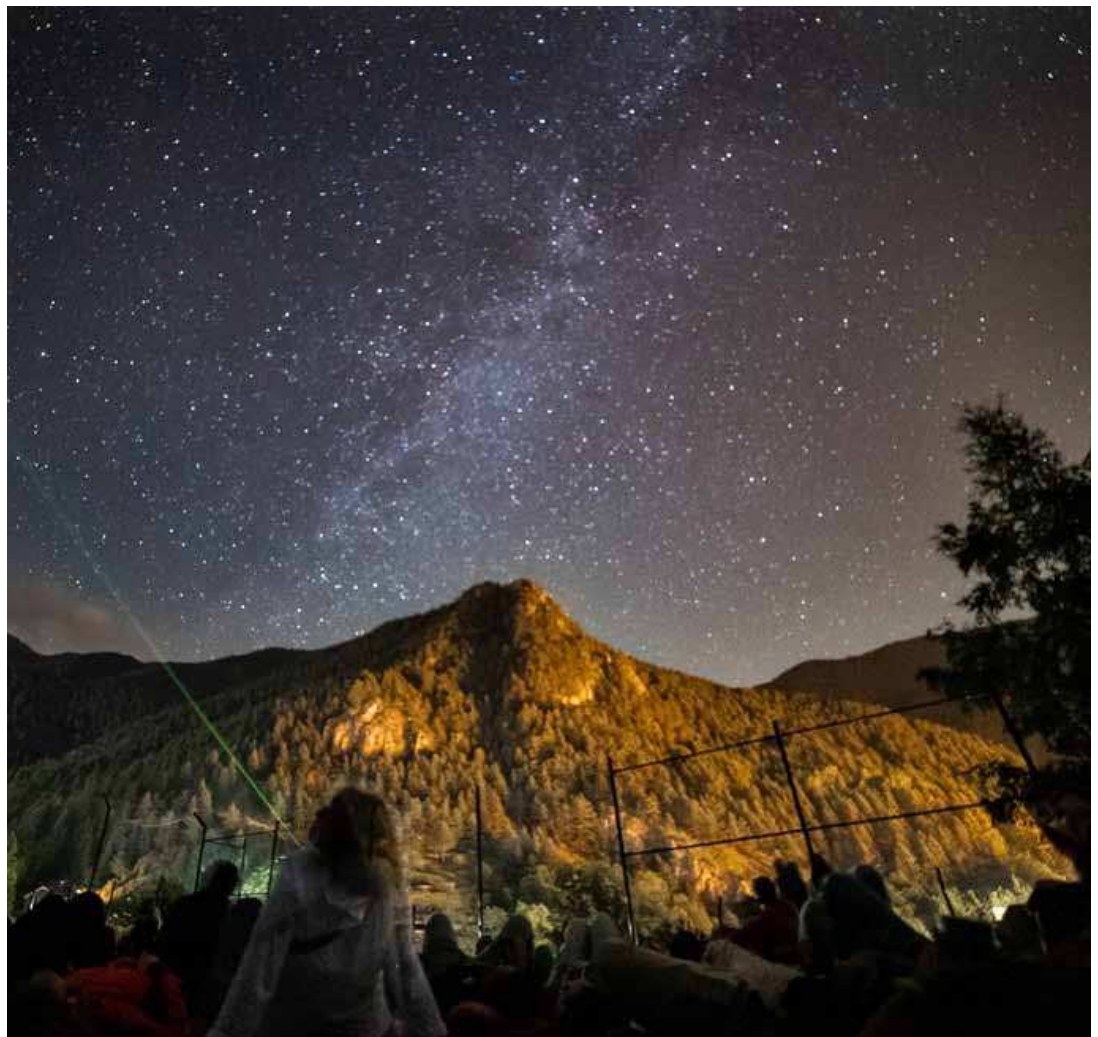
La Massana disposa de la doble certificació de Destinació Turística i Reserva Starlight Recordem des del 2023.

El matí de dissabte es dedicarà a les conferències científiques per descobrir la bellesa de l'univers i submergir-nos en el siste-